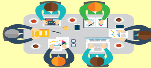
ÜMRANIYE REHBERLİK VE ARAŞTIRMA MERKEZİ