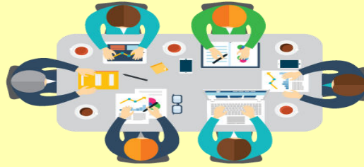
ÜMRANIYE REHBERLİK VE ARAŞTIRMA MERKEZİ